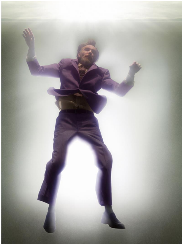
David LaChapelle Bartholomew . 2007 Serie Awakened

David LaChapelle , conocido también como el «Fellini de la fotografía», es considerado el fotógrafo más célebre del mundo. A sus 55 años, su inabarcable colección de retratos de celebridades lo han convertido en referente clave del arte pop del siglo XXI, una producción artística recogida, recientemente, en Lost + Found y Good news .