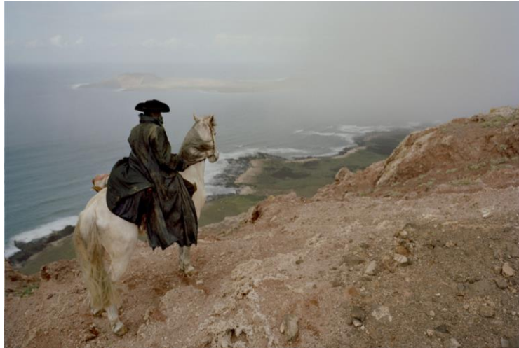
Julian Rosefeldt American Night III . 2009

Entre sus trabajos destacan «Lonely Planet» (2006) o «American Night» (2009), creaciones definidas por convertirse en complejos ejercicios de «cine dentro del cine», en sintonía con las piezas dramáticas de Shakespeare o Calderón de la Barca. Para Rosefeldt su estructura narrativa es como una matrioshka , todo es un símbolo del componente cíclico de la vida.