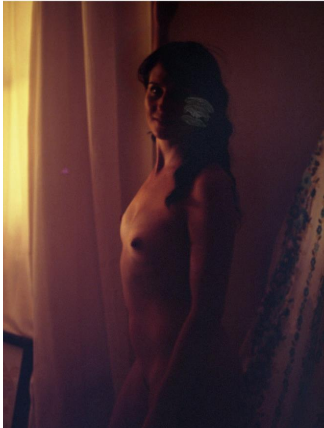
Shizuka Yokomizo All . 2008

En las fotografías y videos de Shizuka Yokomizo se respira, como en pocas obras, la relación invisible entre el artista/espectador y el sujeto representado, a la vez que se percibe un diálogo secreto, que nos habla del universo de lo privado y su apertura a la realidad artística.