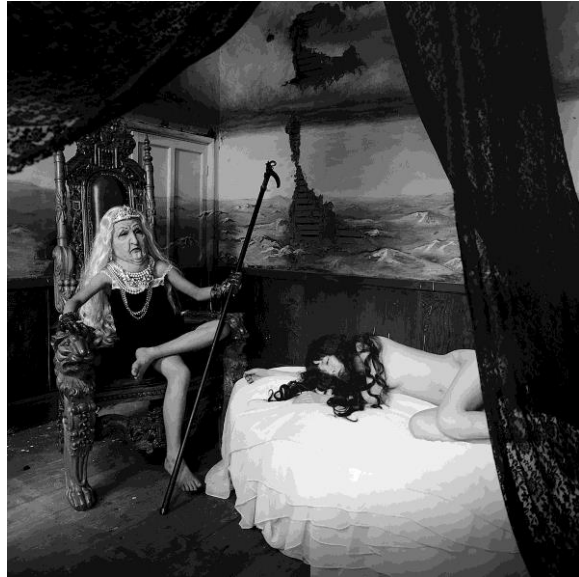
Miwa Yanagi Erendira . 2004 Serie FairyTale

Es una de las más importantes fotógrafas japonesas del mundo. Ha realizado prestigiosas exposiciones como las organizadas en Deutsche Guggenheim de Berlín o en el Museo Marugame, en Japón. Después de haber realizado algunas performances, videos y su conocida serie fotográfica «Elevator Girls», destaca el trabajo realizado en 1999, en una serie de fotografías denominada «My Grandmothers», en la que la artista japonesa transforma digitalmente fotografías de modelos para situarlas en el futuro en el que ellas mismas se imaginan, dentro de cincuenta años.