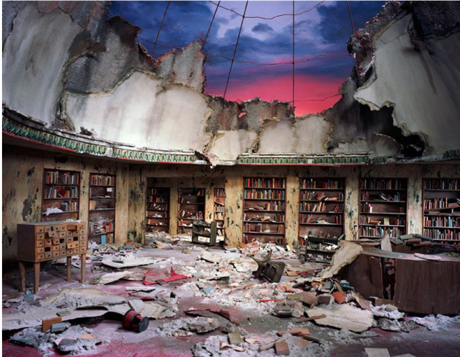
Lori Nix Circulation Desk. 2012

Ciudades inundadas, centrales energéticas pudriéndose, viviendas repentinamente abandonadas, bibliotecas invadidas por la vegetación salvaje, ruinas clásicas reconquistadas por los dinosaurios... La decadencia y descomposición de nuestro mundo es el tema que inspira a Lori Nix para crear sus inauditas obras de arte.